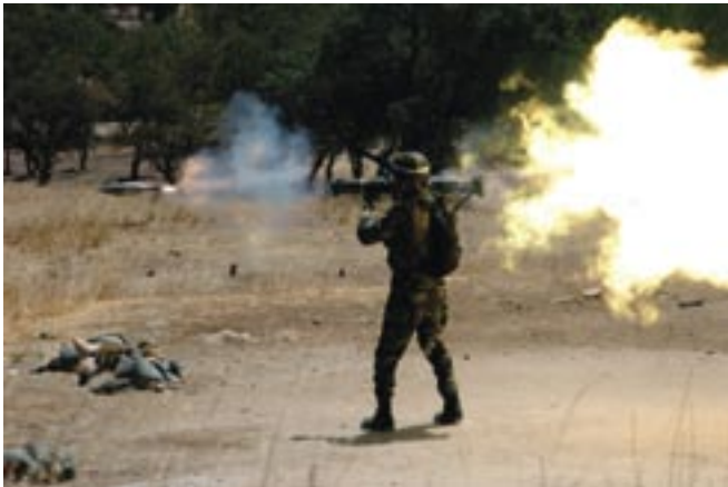
En amerikansk soldat skjuter med AT 4 , juli 2004.

AT 4 i amerikanska händer är en historia som till stor del handlar om krig. Samtidigt som USA invaderade Grenada i oktober 1983 gav regeringen tillstånd för provleveranser till USA. När USA invaderade Panama i december 1989 användes AT 4 vid invasionen. Ett par år senare, under Gulfkriget användes AT 4 igen för att bland annat slå ut de irakiska stridsfordonen. 24 Det har även använts av de amerikanska trupperna i Irak 2003 och i Afghanistan.