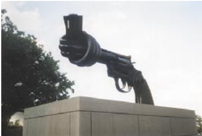
"Non Violence" fredssymbol av den svenska konstnären Carl Fredrik Reuterswärd framför FN:s huvudkontor i New York.