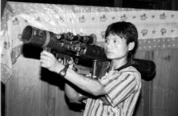
Burma våren 1994. Ett Carl Gustaf granatgevär beslagttaget av Karenfolket.

En stor köpare av Carl Gustaf är USA och man har senast använt vapnet i krig i Afghanistan och Irak.