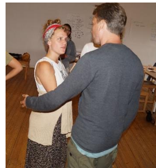
För andra året i rad arrangerades träning i civilkurage, ickevåld och fredskultur