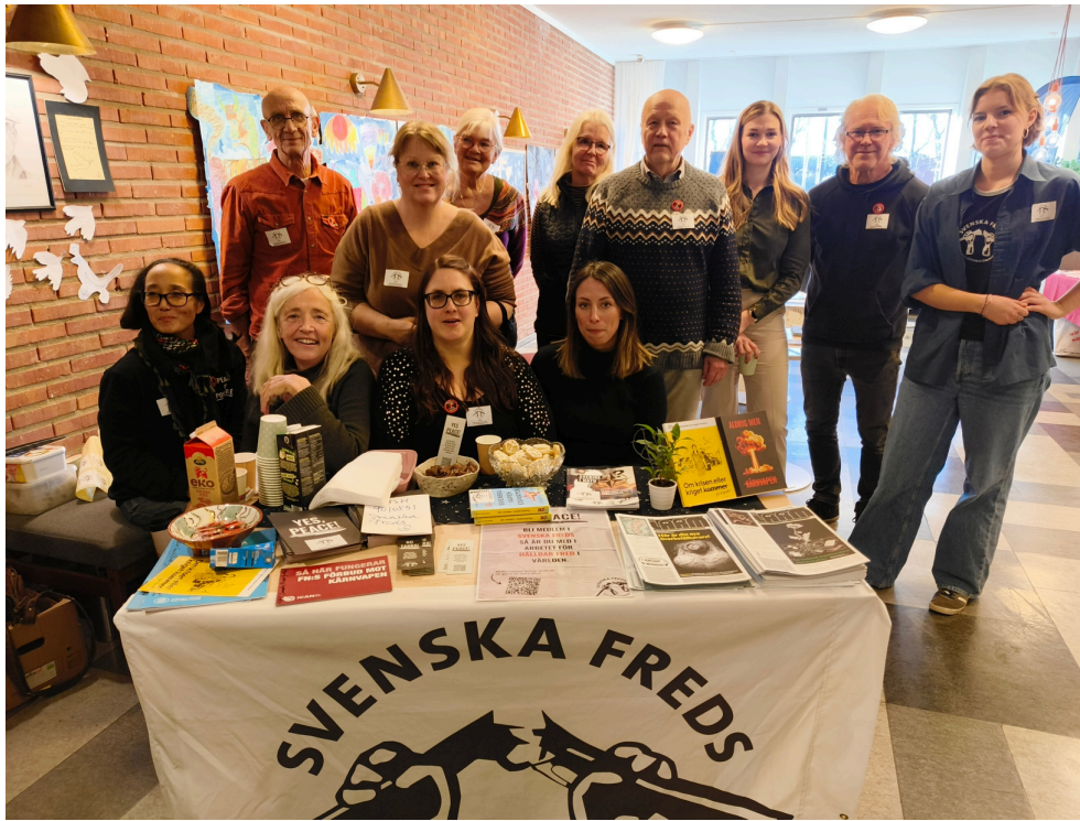
Bild från Internationella dagen i Hemse, 15 november 2025.