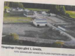
Tingslinge Frejes gård i Gnesta.

Vår grupp har också medverkat vid andra arrangemang och vid sådana tillfällen bl a fått kontakt med personer, intresserade att delta i vår verksamhet. Vi har därmed ett icke försumbart antal adresser i vår mejlinglista. Det har dock ofta visat sig att steget är större att verkligen närvara vid våra möten än att anteckna sitt intresse på en anmälningslista. Under detta första verksamhetsår har vi också ägnat oss åt att etablera gruppen och att finna verksamhetens former och innehåll. Vår uppgift har förvisso under året inte blivit mindre aktuell.